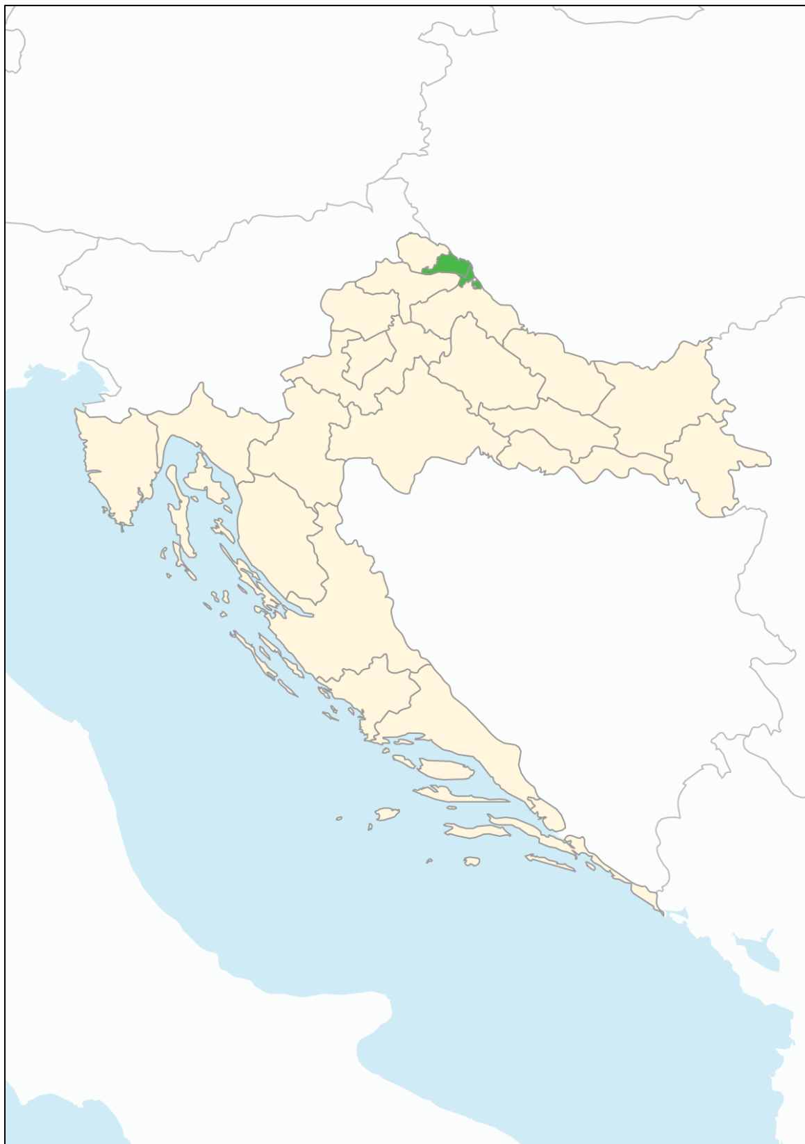
Slika 2: Karta položaja LAG-a na karti Republike Hrvatske